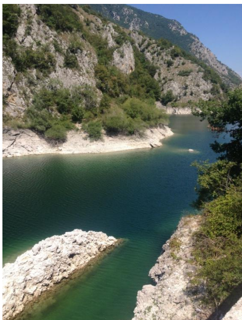
Nielen more, ale i krásne jazerá