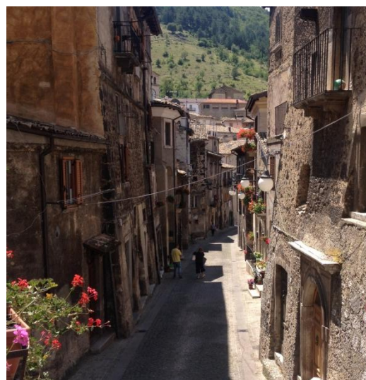
Malebné horské mestečko Scanno