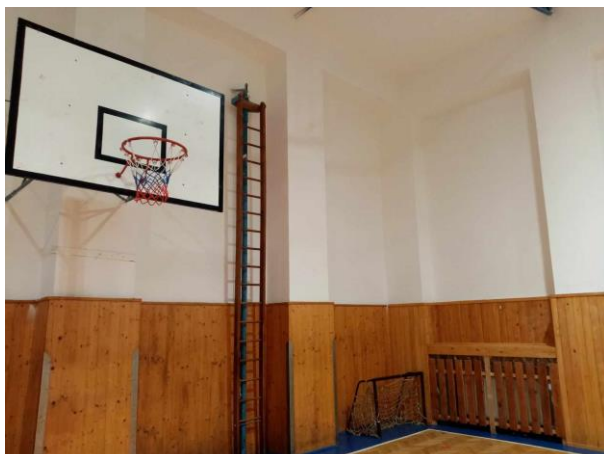
Telocvična – nový náter