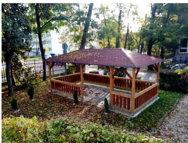
Altánok – Participatívne rozpočty