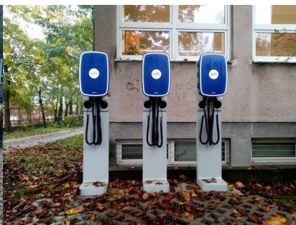
Kolobežky – eko aktivita KSK