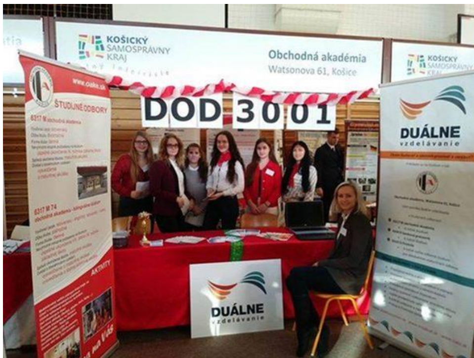
Prezentácia školy na 13. ročníku medzinárodného veľtrhu vzdelávania a pracovných príležitostí „PRO EDUCO“