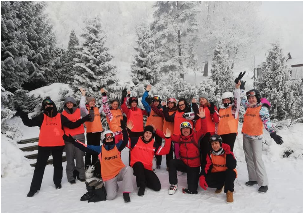
Lyžiarský kurz Drienica