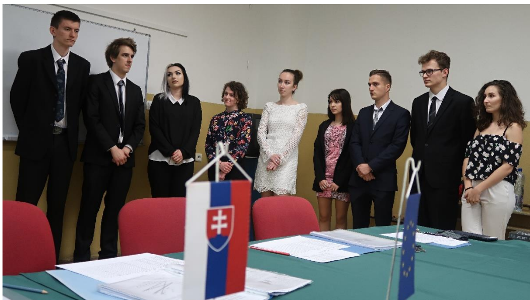
Ústne maturitné skúšky