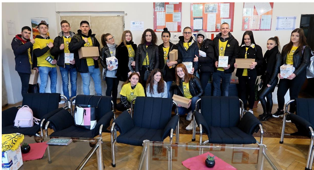
Deň narcisov na „Watsonke“

Mobilný odber krvi na OA - 27. novembra 2018 sa na našej škole uskutočnil mobilný odber krvi. Týmto sme sa zapojili do akcie organizovanej Červeným krížom - Študentská kvapka krvi. Odvahu nabralo 17 študentov a zamestnancov školy. Mobilný odber uskutočnila Transfúzna stanica Košice-Šaca, ktorá krv našich darcov doručí tam, kde to bude potrebné. Všetkým, ktorí sa zapojili, ďakujeme.