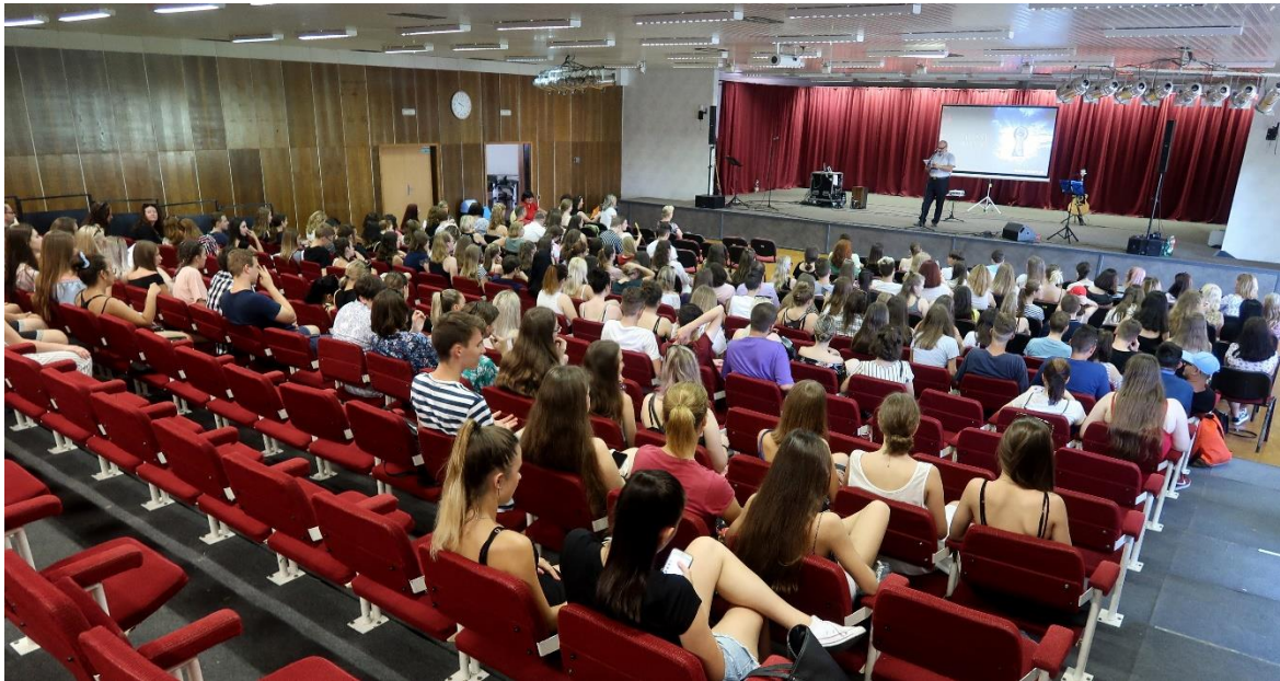
Záverečné vyhodnotenie šk.roka 2018/2019