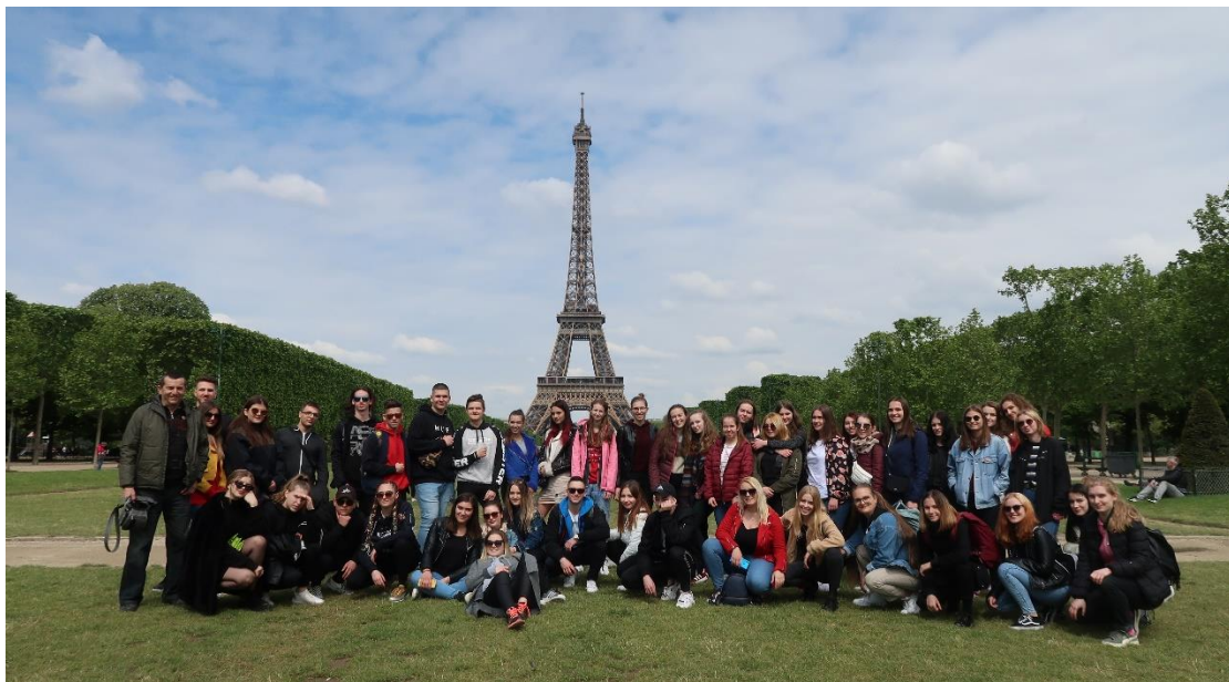
Výlet do Francúzska