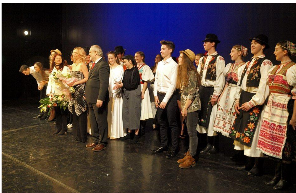
Kultúrny program pri príležitosti 120. výročia založenia školy