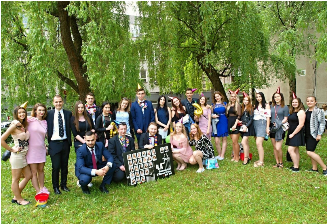
Absolventi IV. A