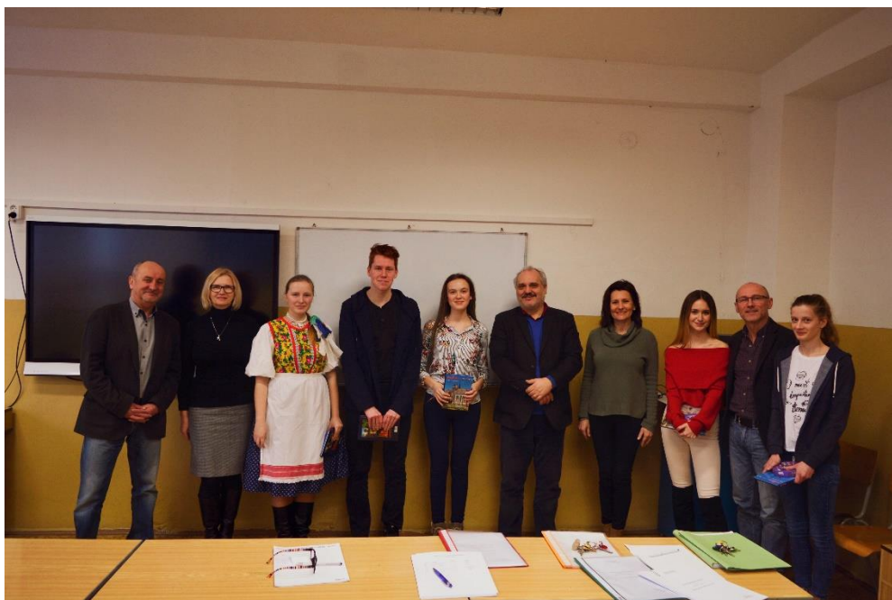
Školské kolo SOČ