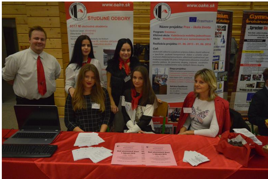
Prezentácia školy na veľtrhu informácií „Správna voľba povolania“