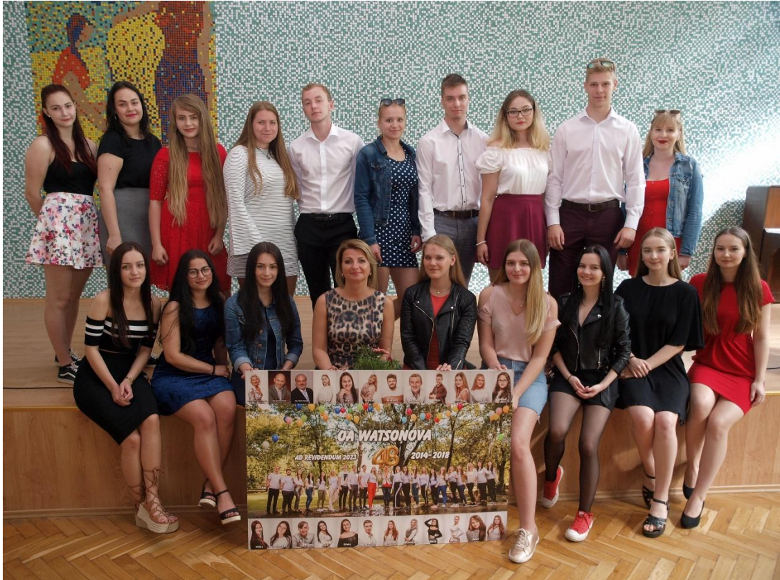
Absolventi IV. B