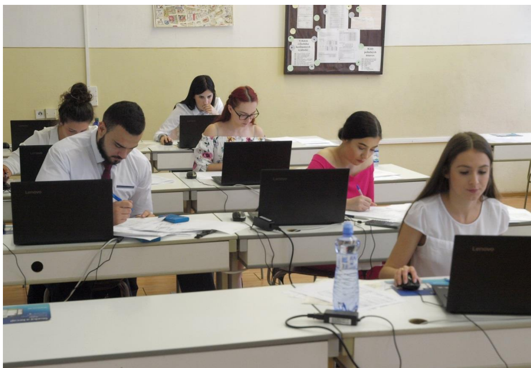
Praktická časť odbornej zložky