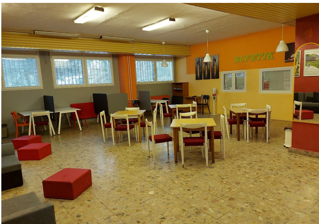
Spoločenská miestnosť - bufet pre žiakov