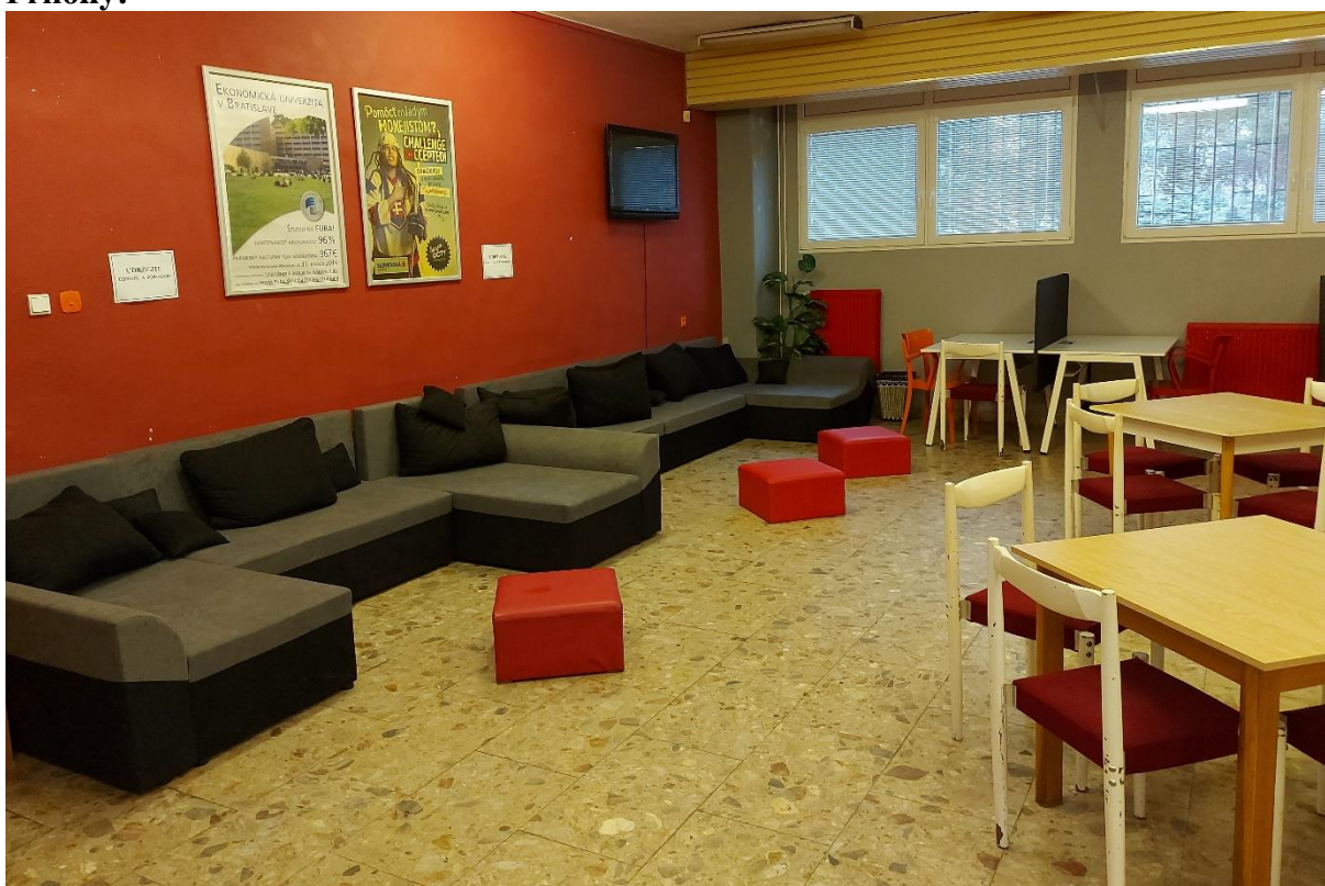
Spoločenská miestnosť - oddychová zóna