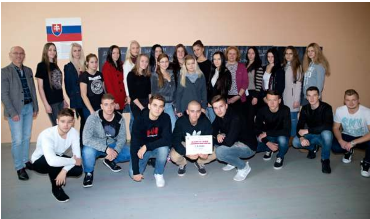
III.A trieda - najlepšia v zbere papiera v školskom roku 2015/2016