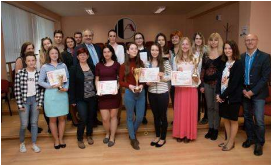
Najlepší podnikateľský plán - regionálne kolo