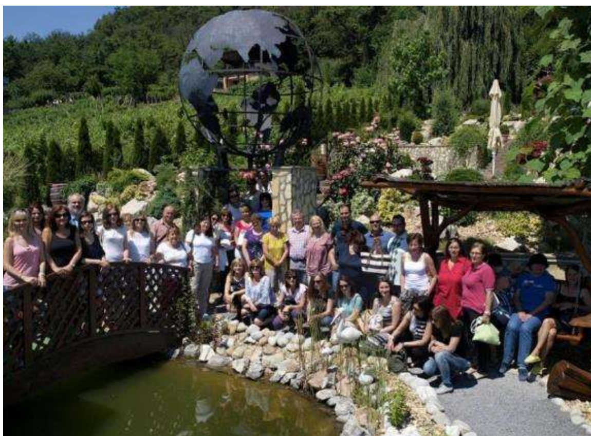
Ukončenie šk. roka 2015/2016 - odborná exkurzia vo Viničkách