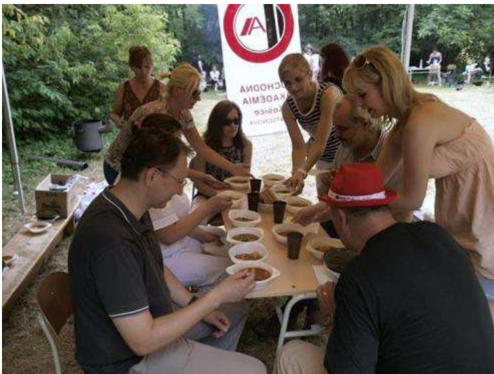
"Guláš battle"- súťaž vo varení kotlíkového guláša žiaci vs. učitelia