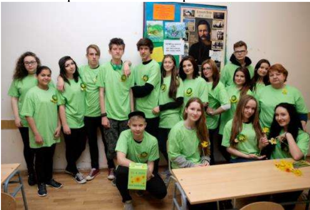
Deň narcisov na „Watsonke“