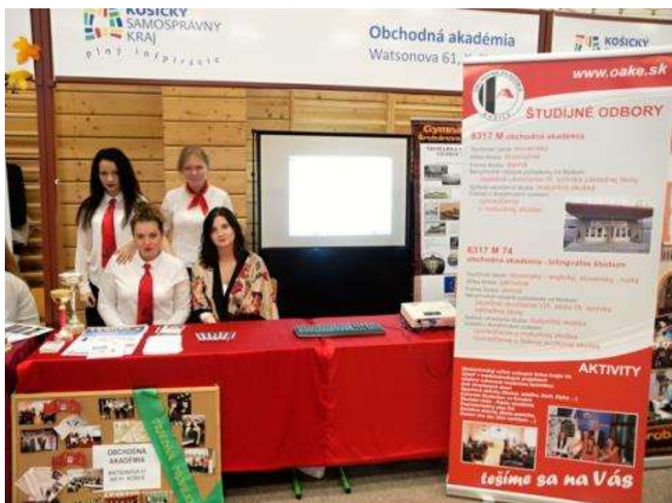
Prezentácia školy na veľtrhu informácií „Správna voľba povolania“