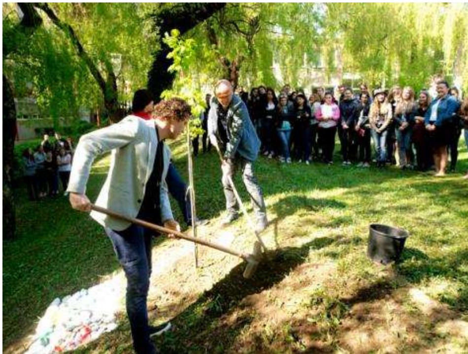
Slávnostné sadenie olympijskej lipy–Deň zeme