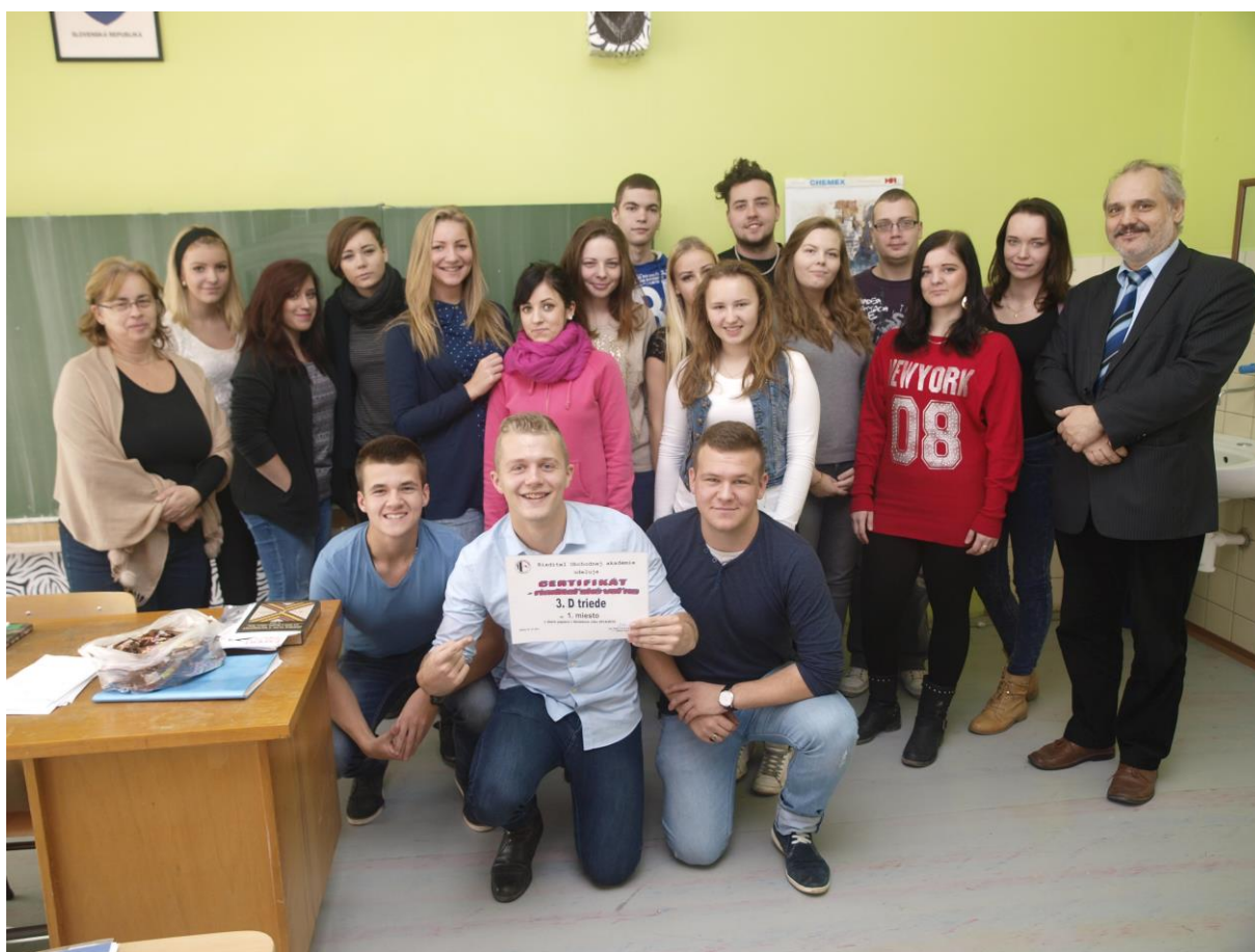
III.D trieda - najlepšia v zbere papiera v školskom roku 2014/2015