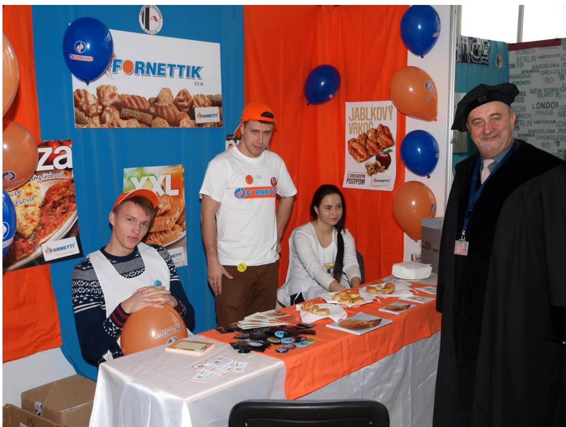
Cvičné firmy sa predstavili aj na DOD

Na veľtrhu CF v Ostrave 3.miesto v kategórii Najlepšia cvičná firma