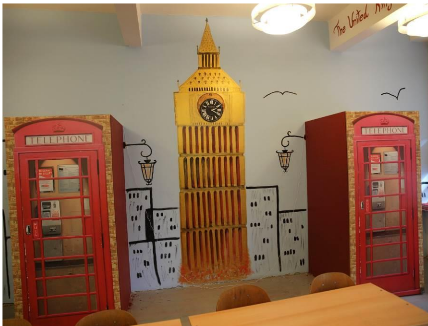
Odborná učebňa ANJ – bilingválna sekcia