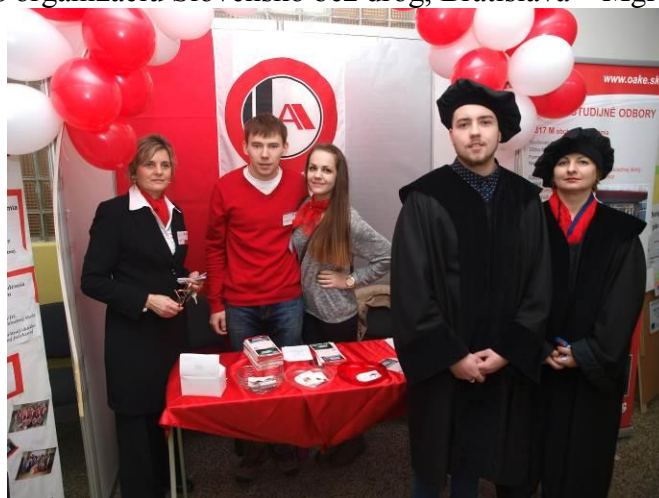
Deň otvorených dverí na našej škole