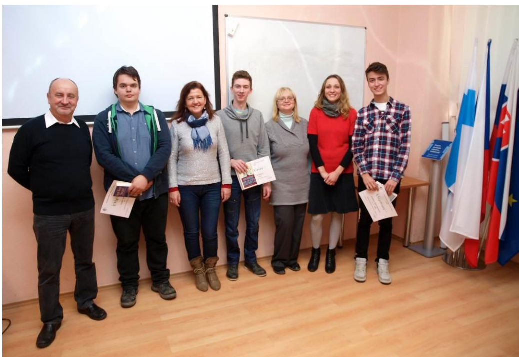
Olympiáda v ANJ - bilingválna sekcia