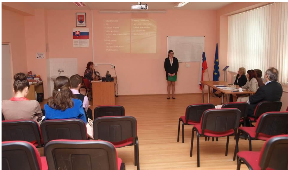
Súťaž o najlepší podnikateľský plán