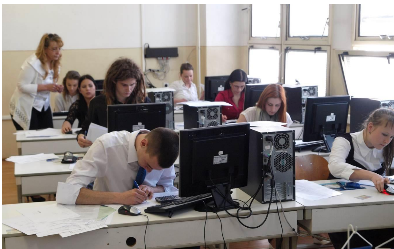
Maturitná skúška - PČOZ