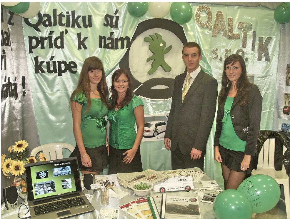
CF Qaltik na veľtrhu v Košiciach