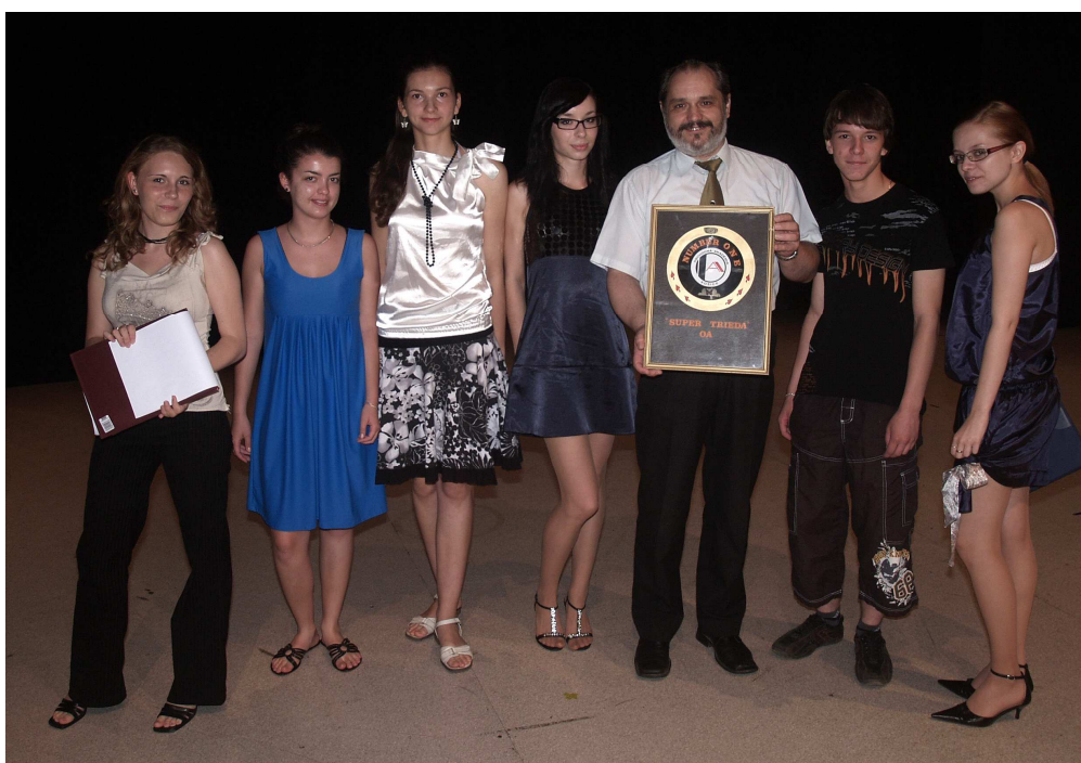
Odovzdávanie putovného diplomu Super trieda zástupcom 3.B