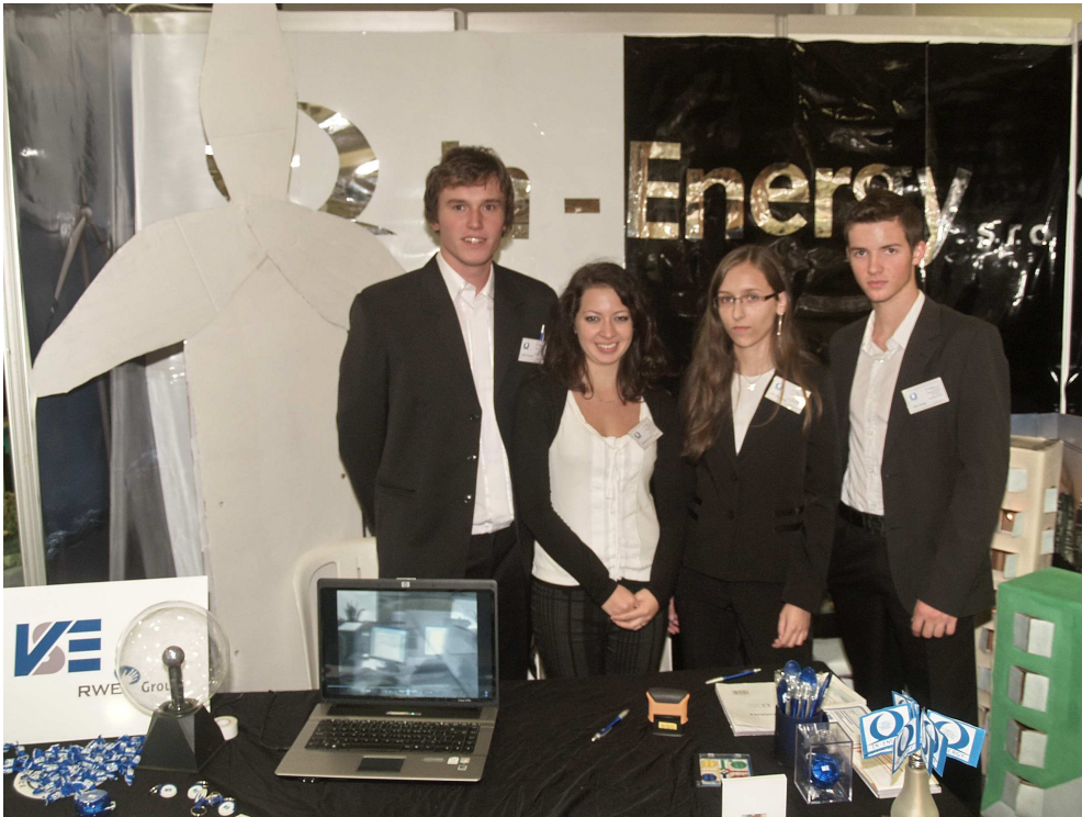
CF In-Energy na veľtrhu v Košiciach