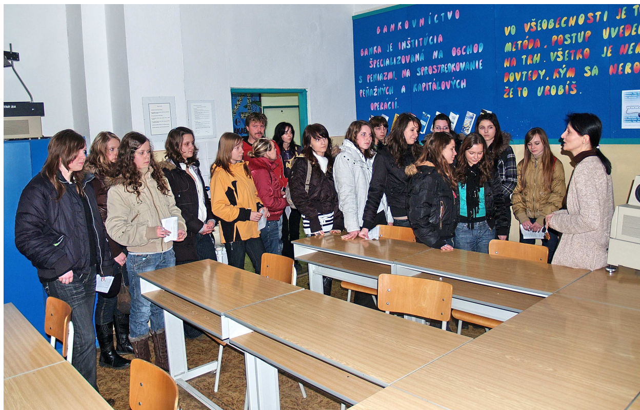
Nových záujemcov o štúdium môžu zaujať aj kvalitne vybavené učebne – Deň otvorených dverí 25.01.2009