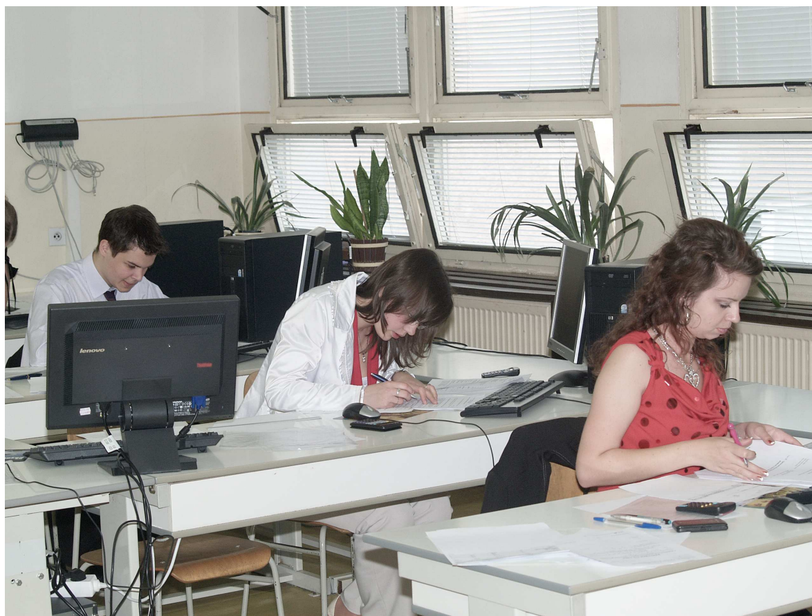
Žiaci počas maturitnej skúšky z praktickej zložky odborných predmetov

Študenti na maturitných skúškach preukázali veľmi dobré vedomosti a všetci v danom predmete prospeli.