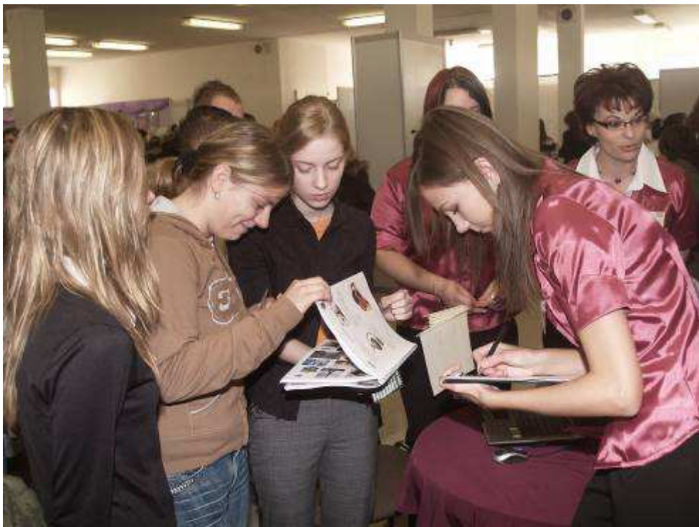
Takto sa na veľtrhu cvičných firiem obchodovalo