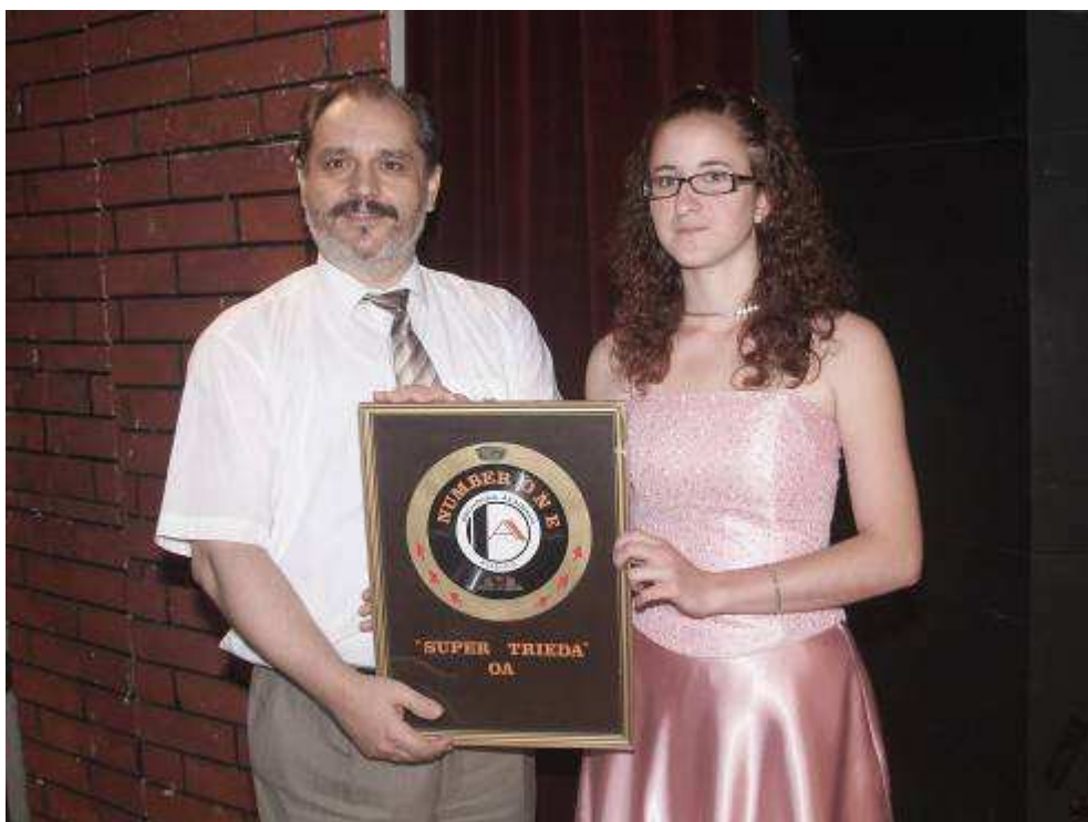
Super triedou OA sa stala 1.F – ocenenie z rúk riaditeľa školy preberá predsedníčka triedy