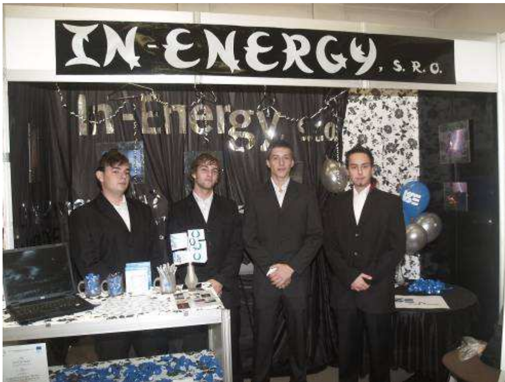
CF In-Energy na veľtrhu v Košiciach, kde získali 1.miesto