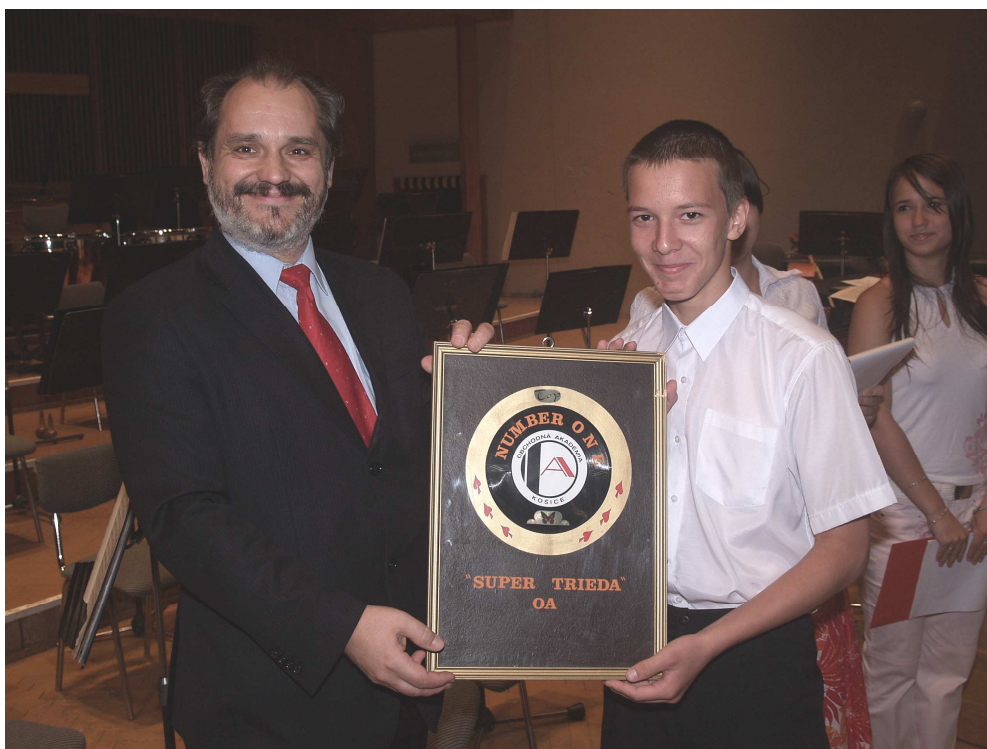
1.B - Super trieda OA