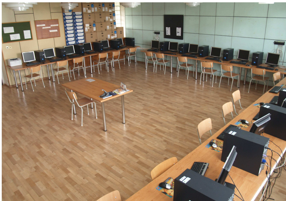
Nová učebňa ADK