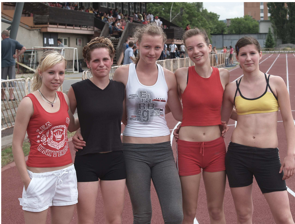
Naše najúspešnejšie reprezentantky v atletike