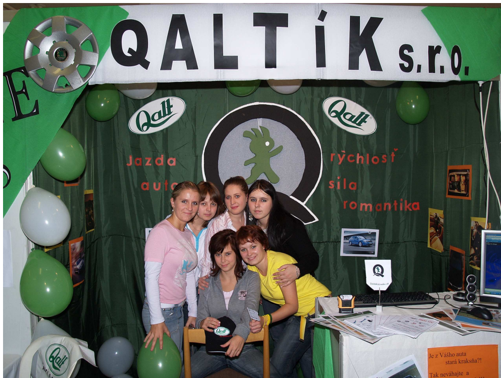
Najúspešnejšia CF na 4. MVCF v Košiciach