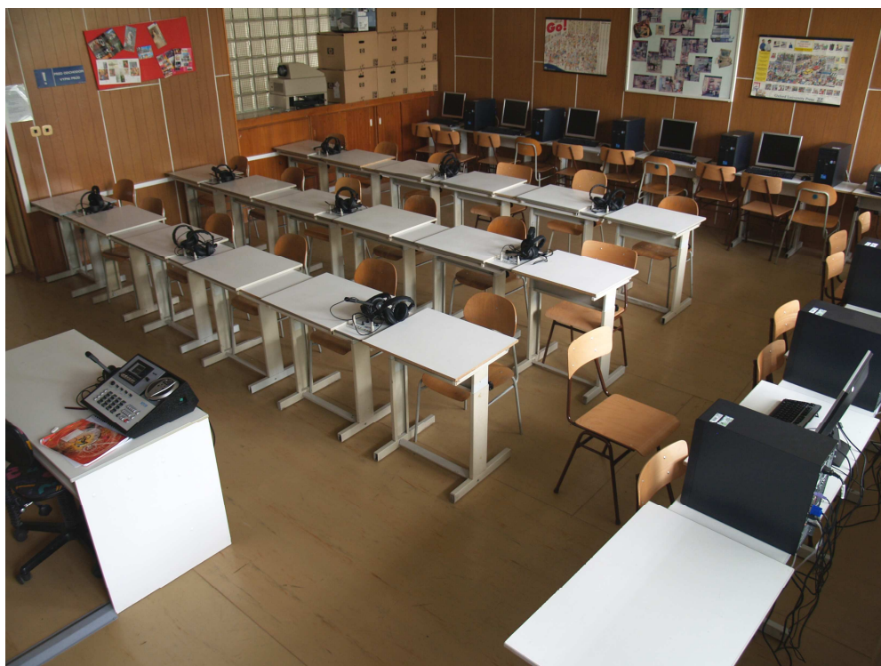
Nová učebňa – jazykové laboratórium