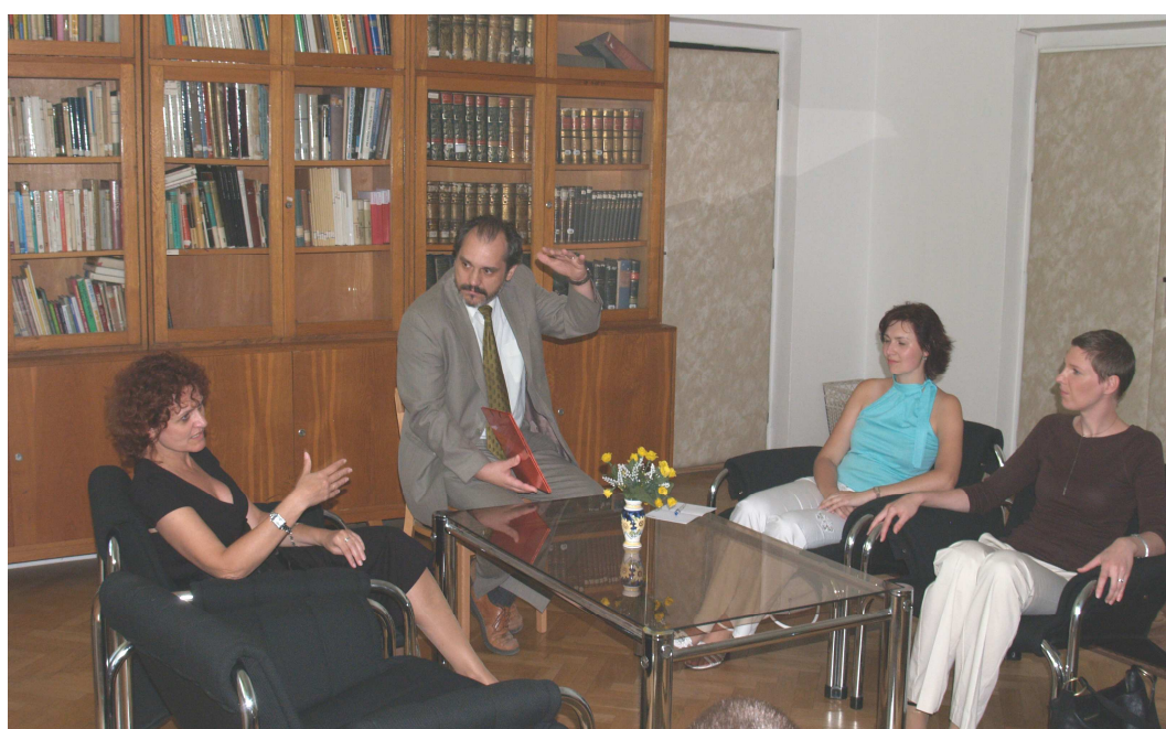
Pracovné stretnutie so zástupkyňou centra CF ŠIOVa zástupkyňami VSE