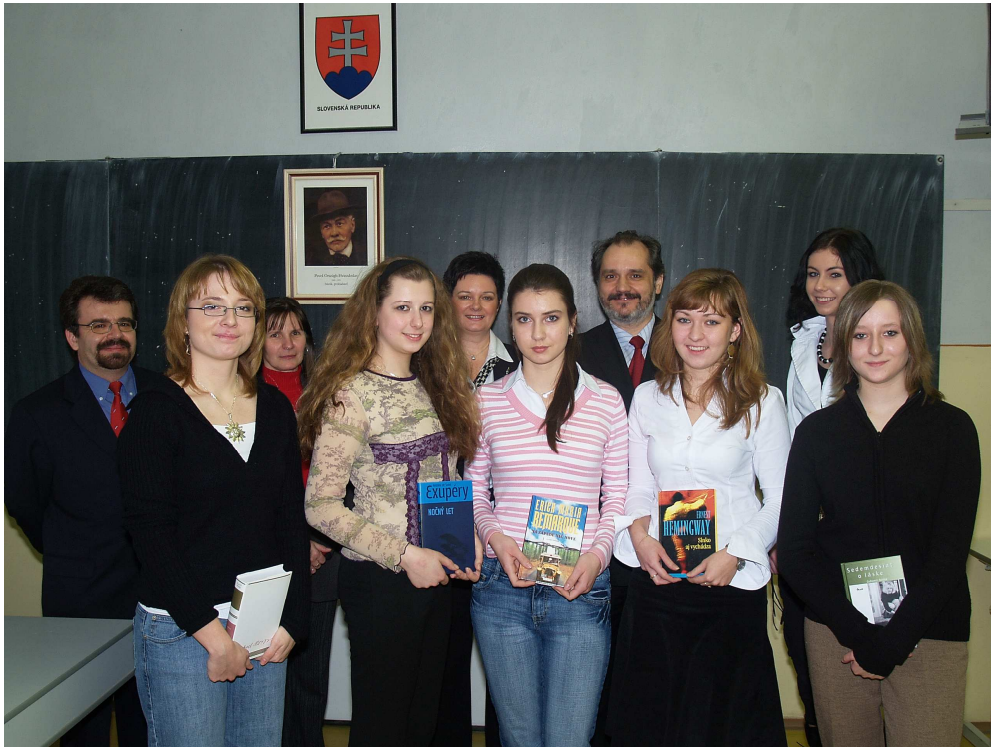
Vít'azi Hviezdoslavovho Kubína