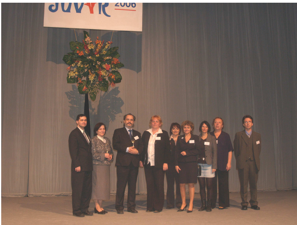
Na 9.MVCF v Bratislave sme získali „Cenu ekonomickej praxe“