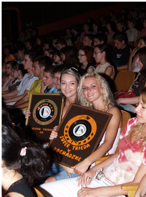
Super trieda 1.A