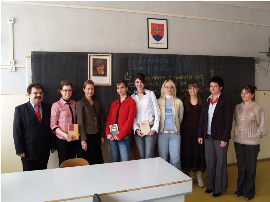
Vít'azi šk. kola súťaže Hviezdoslavov Kubín