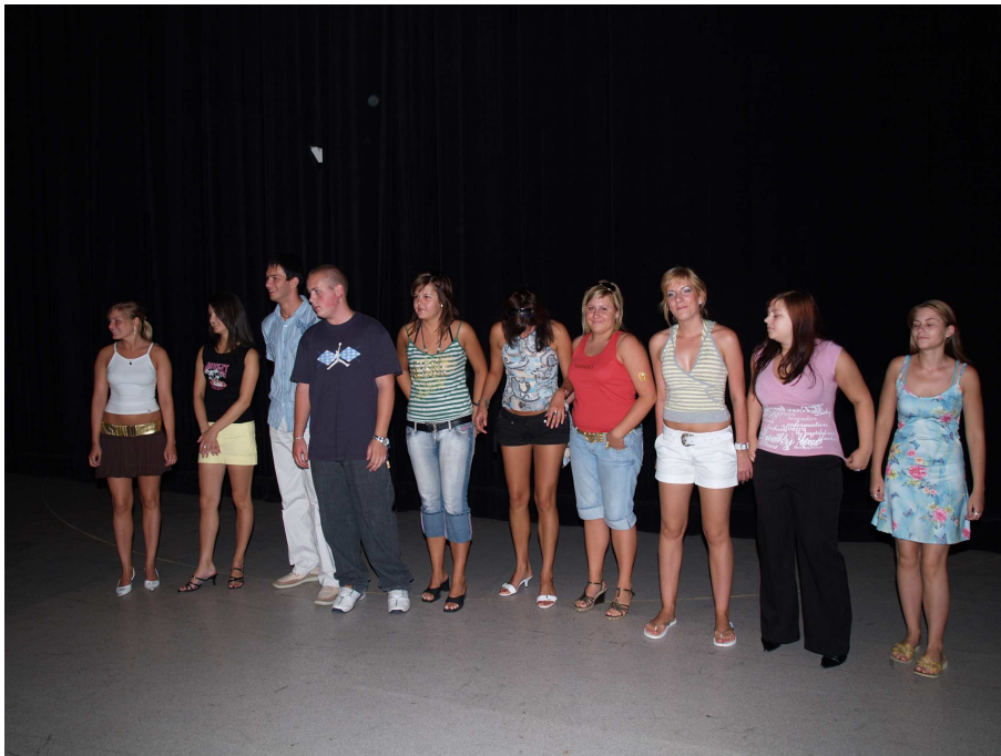
Študenti- účastníci odbornej stáže v Grécku pri preberaní certifikátov