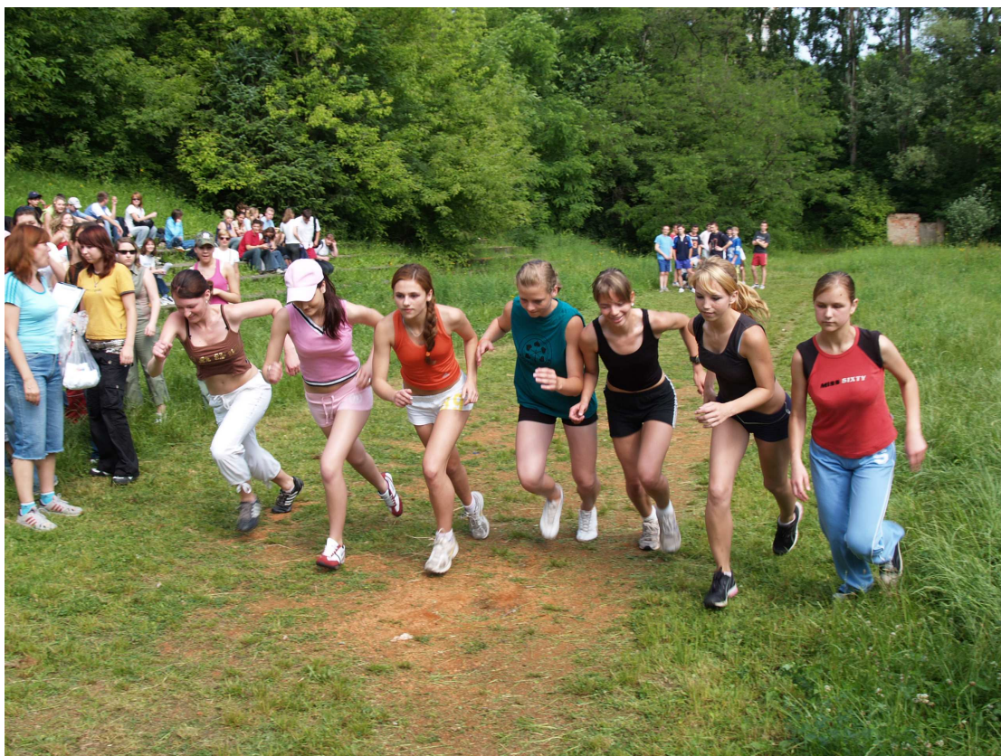
Beh Olympijského dňa