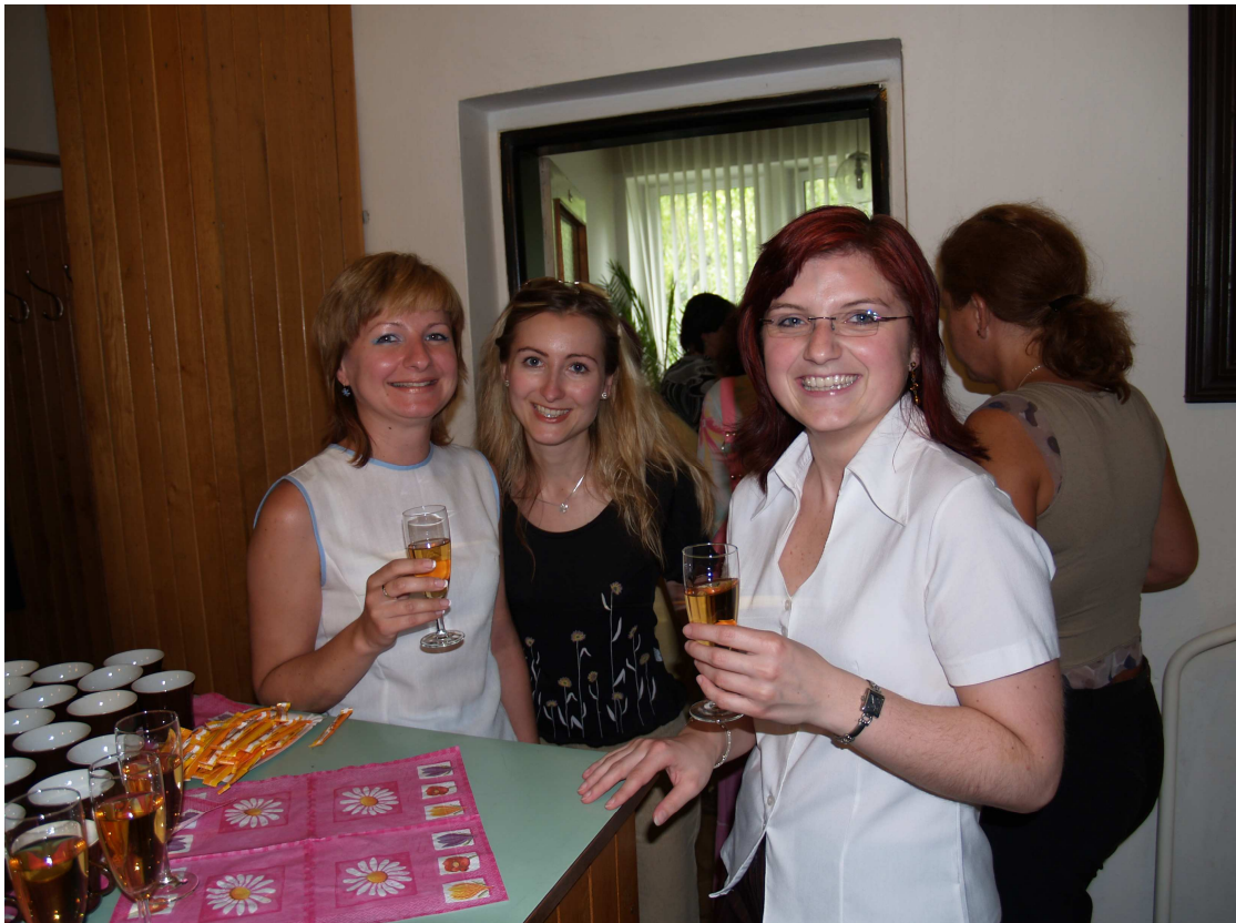
...a privítali sme medzi nami nové kolegyně