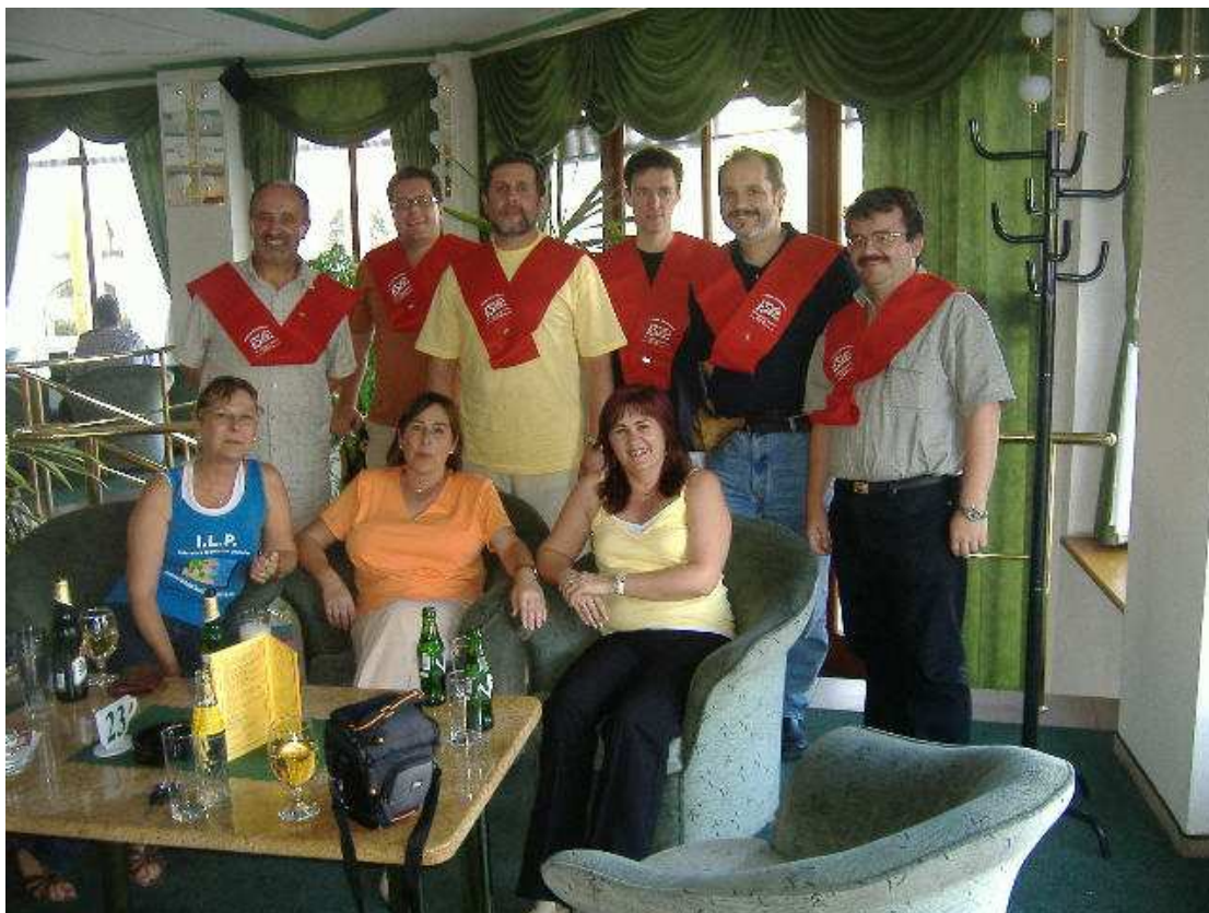
Stretnutie so španielskymi kolegyňami v Košiciach