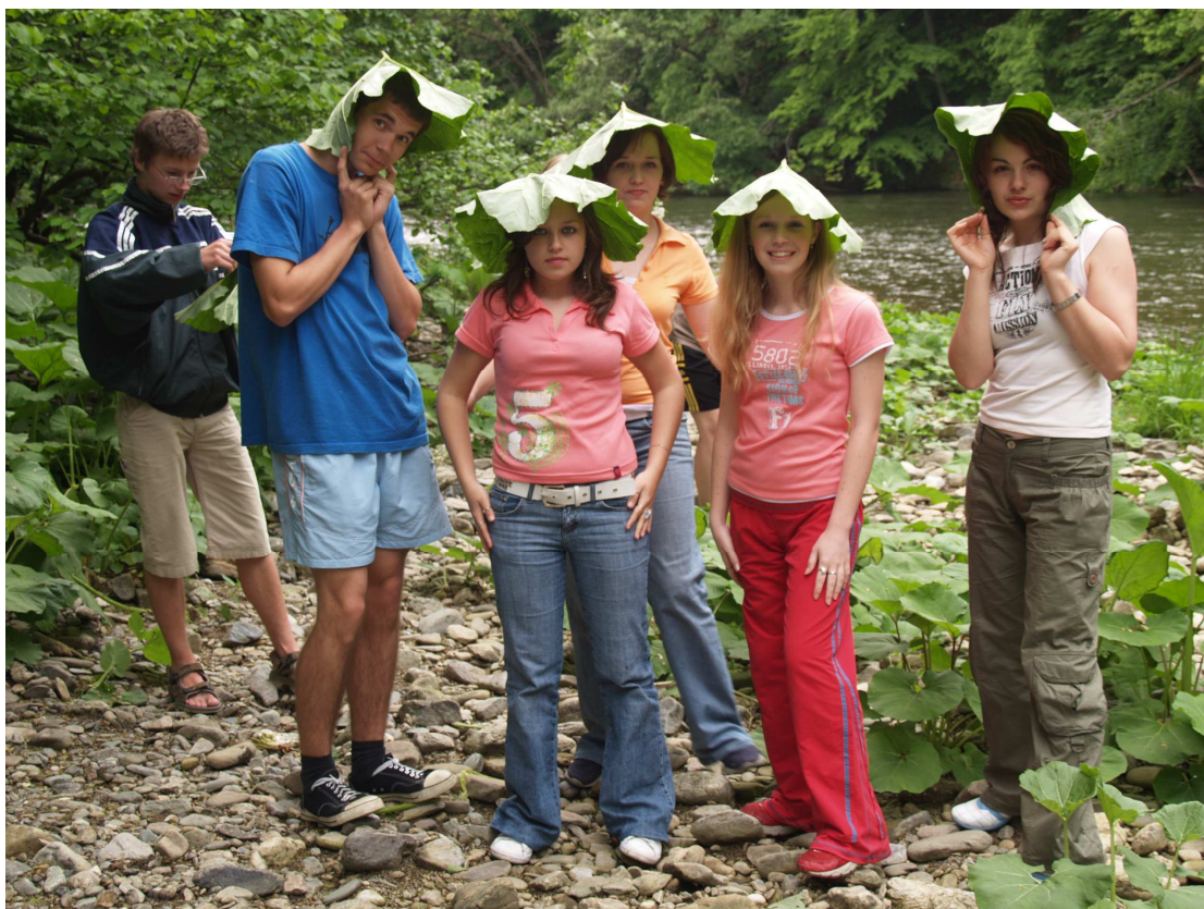
Účastníci telovýchovného kurzu v Kysaku