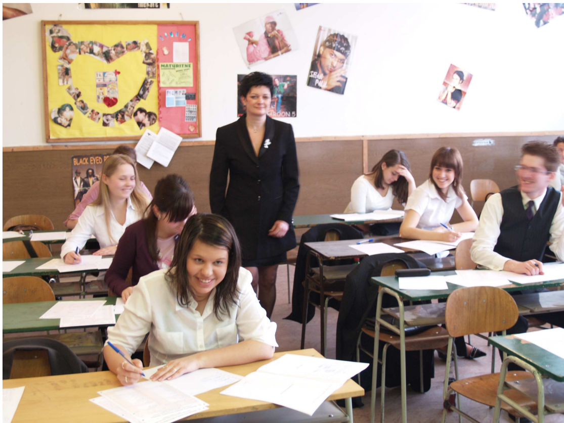
...prebiehali v príjemnej pracovnej atmosfére