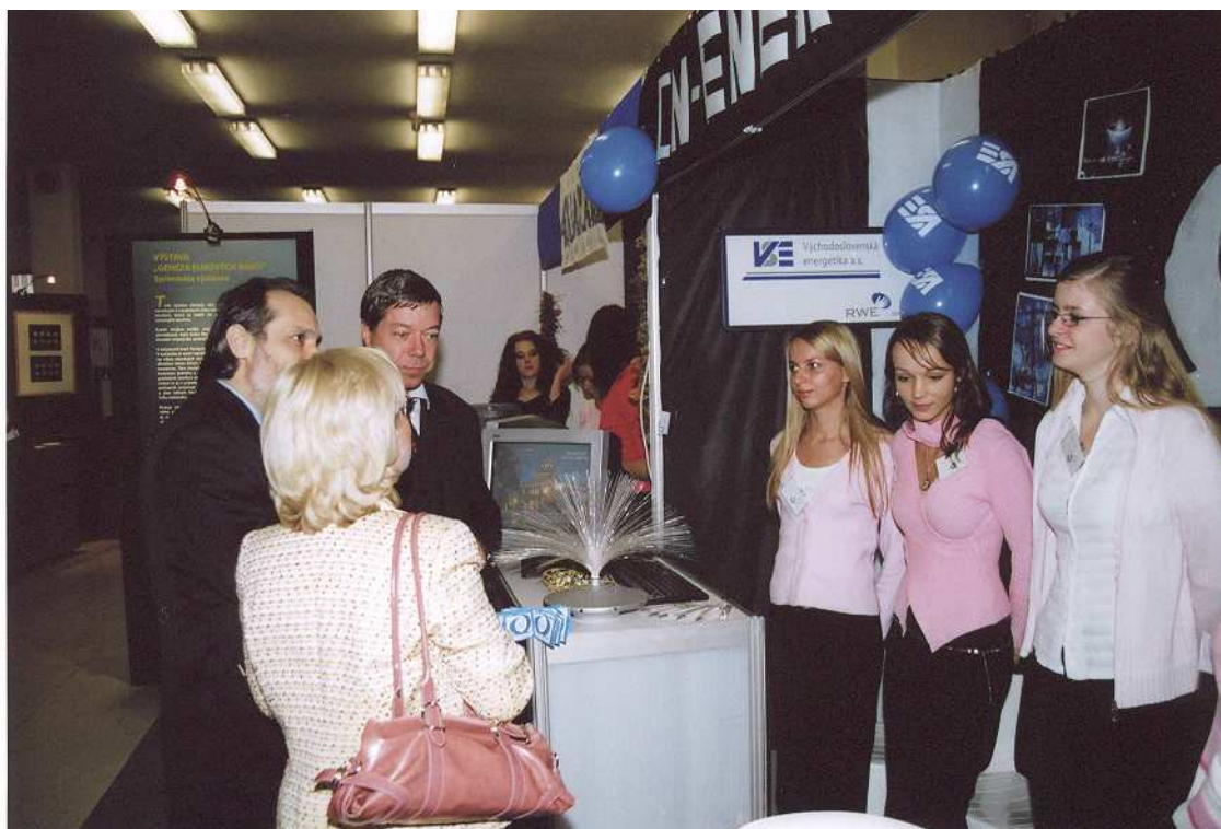
Stretnutie študentov z cvičnej firmy s predsedom KSK