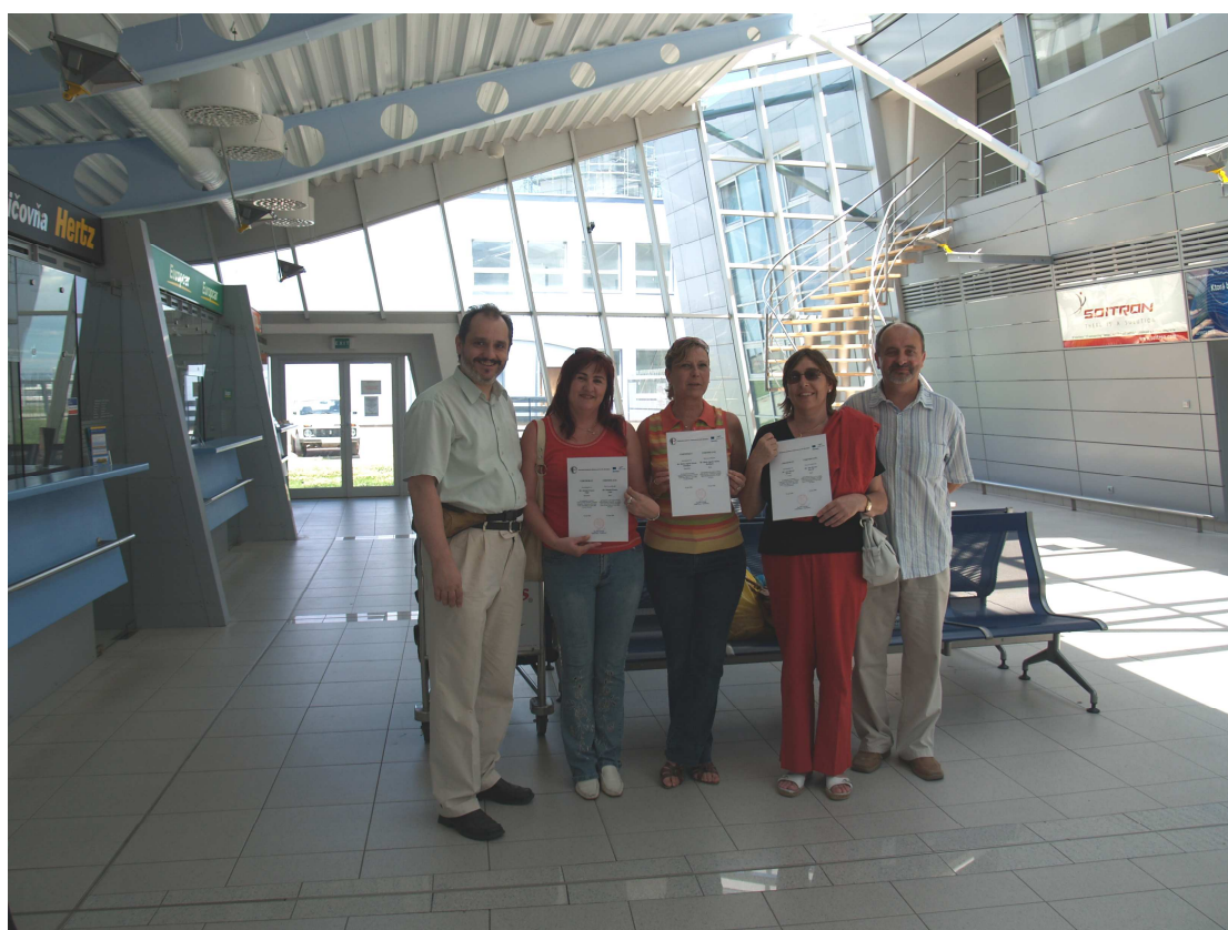
Rozlúčka so šarmantnými kolegynami zo Španielska