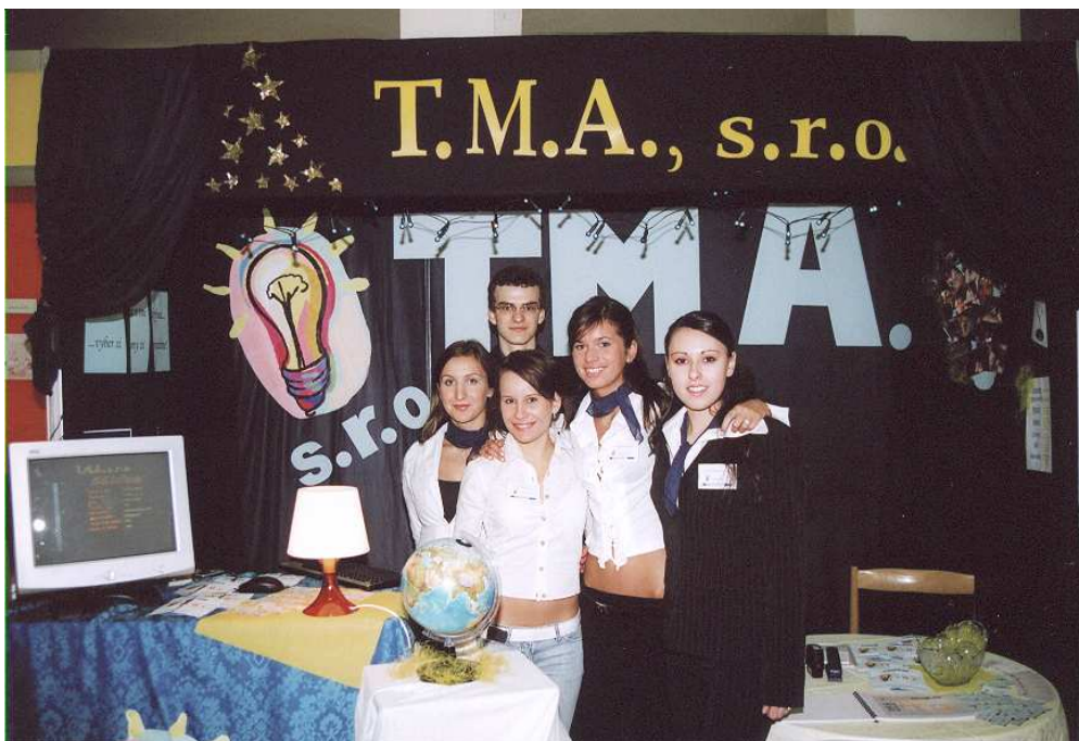
Vítazná cvičná firma na veľtrhu v Košiciach