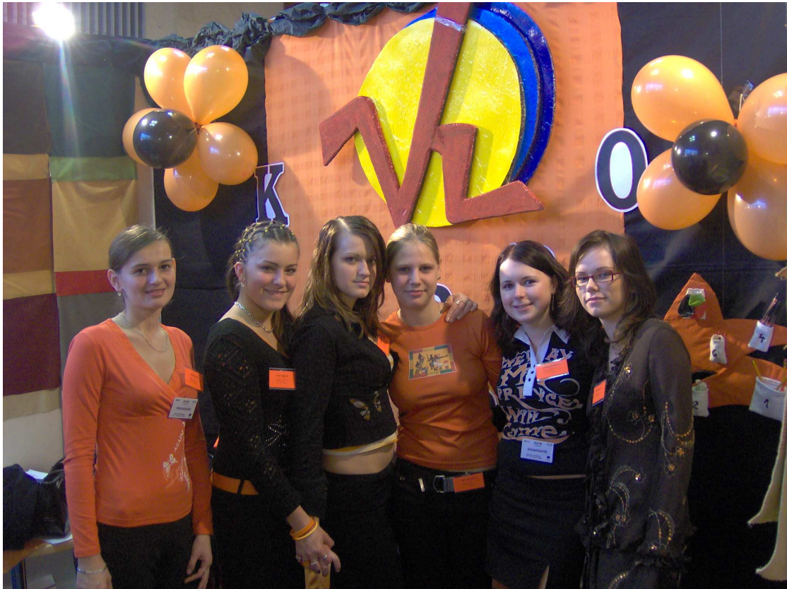
KARPO, s.r.o. – naša najlepšia cvičná firma na veľtrhu v Bratislave