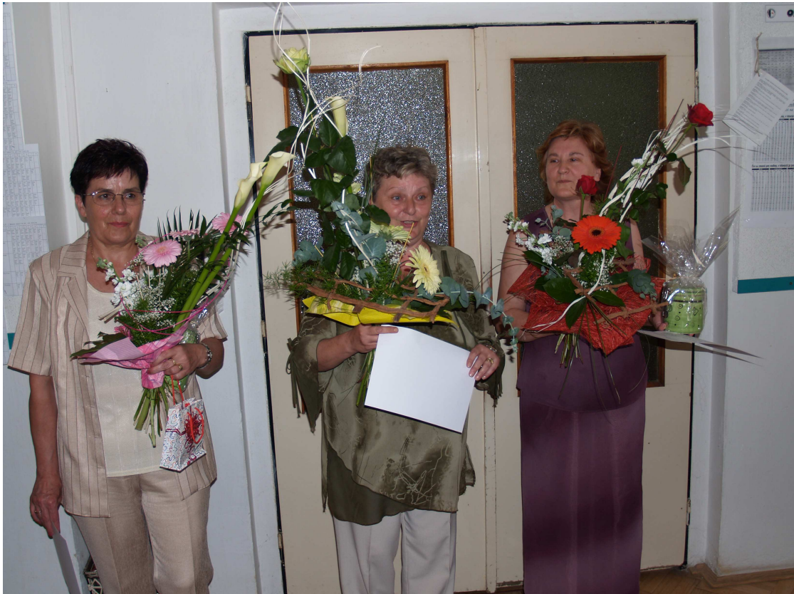
Výmena generácií - poďakovali sme za prácu milým kolegyniam odchádzajúcim do dôchodku ...